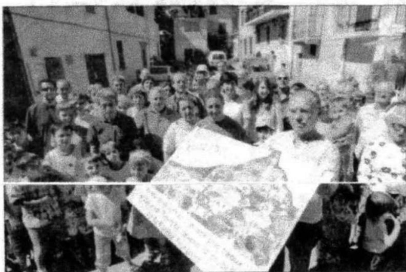
A Piène-Haute, tous les habitants auraient signé la pétition de défiance.

Censé fonctionner pendant trente ans, il absorberait les déchets ultimes de la vallée de la Roya (5000 t par an) mais également ceux de l'est du département, voire d'ailleurs pour atteindre un seuil de rentabilité évalué à 30 000 t.