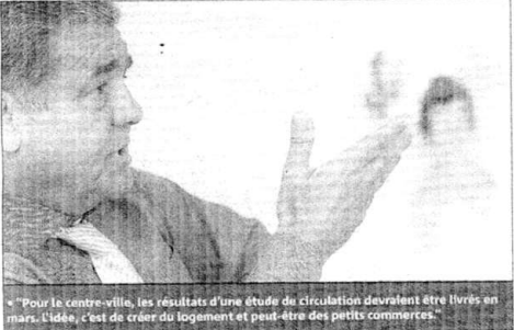
« Pour le centre-ville, les résultats d'une étude de circulation devraient être livrés en mars. L'idée, c'est de créer du logement et peut-être des petits commerces »

Quel est votre avis sur la politique d'Henri Leroy et sur les dossiers évoqués dans cette interview ? L'urbanisme, l'aménagement du centre-ville, celui du quartier de Minelle. Quelle est votre opinion sur les choix politiques de votre maire et sur les échéances électorales à venir ? Faites-le nous savoir. Par téléphone au 04.93.06.37.50 ; par fax au 04.93.06.37.51 ou par Internet à l'adresse suivante : cannes@nicematin.fr