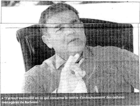
« J'ai tout verrouillé en ce qui concerne le centre d'enfouissement des ordures ménagères de Barbossi »

Cela signifie que les Mandoliens verront le nou-